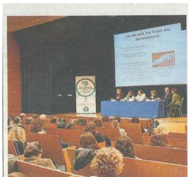
Un momento del Foro de Servicios Sociales.

El próximo jueves, 17 de noviembre, se entregarán los premios Zangalleta de este año, que Fundación DFA otorga a personas y entidades que destacan por su actitud valiente y solidaria, decididas a la lucha por la mejora de las condiciones de vida, derechos