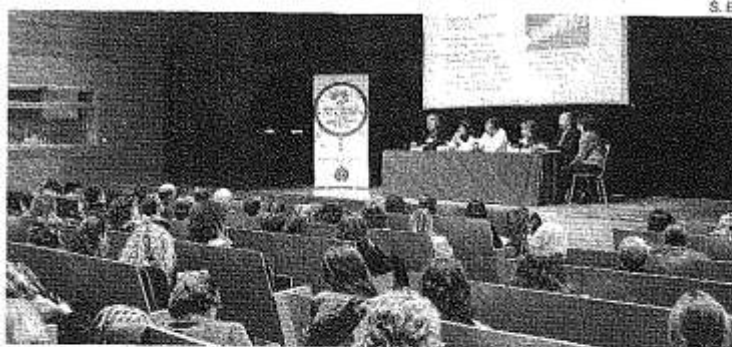
►► Foro del Observatorio de Servicios Sociales y Política Social