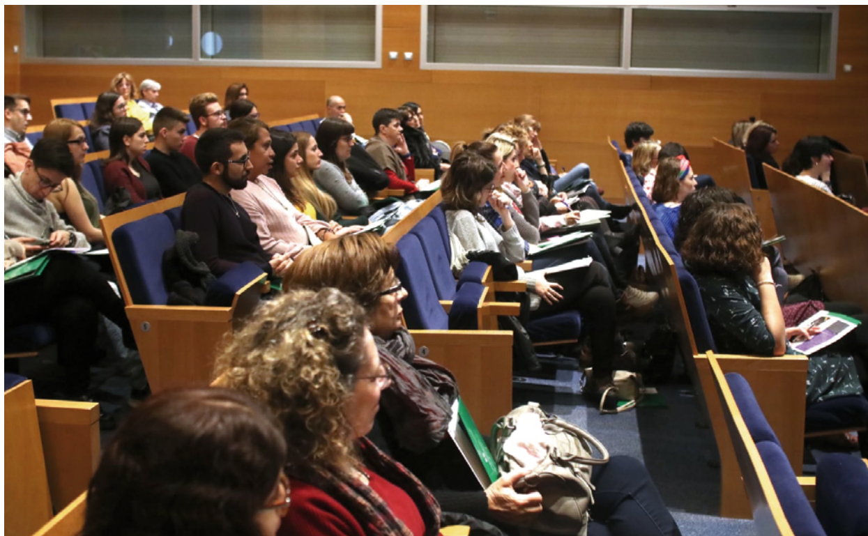
Intervención del público