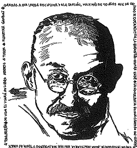
Retrato de Gandhi.

Pero no fue hasta 1846 cuando apareció por primera vez el gran teórico de la desobediencia civil, Henry David Thoreau , encerrado en la cárcel por negarse a pagar sus impuestos fue el primer objetor fiscal de la historia. En 1866 reescribió una confesión bajo el título: la desobediencia civil .